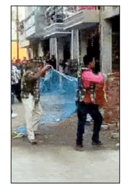
प्रदेश स्वराज • इंदौर

इंदौर के खुईल इलाके में गुरुवार दोपहर एक तेंदुआ निर्माणधीन मकान में बंदा दिखाई दिया। भगाने की कोशिश की गई तो वह लोगों की तरफ झपटो। इससे इलाके में भगदड़ मच गई। घटना का वीडियो सामने आया है। मामला देवगुराडिया गांव के मानसरोवर नगर का है। तेंदुआ को सबसे पहले मकान में कैद कर रहे मजदूरों ने देखा। घटना की सूचना कैदाल रूम को दी गई, जिसके बाद पुलिस मीके पर पहुंची। पुलिस ने फॉरिस्ट विभाग को इसकी जानकारी दी।